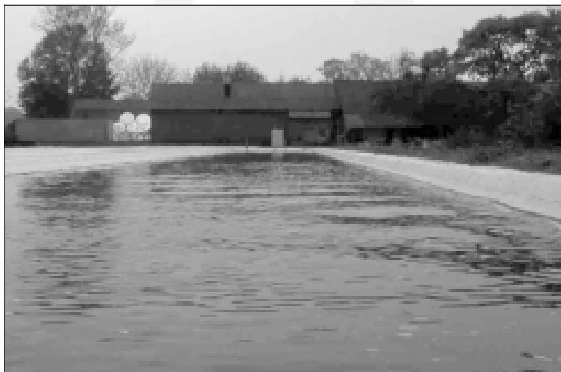
Fig. 1: Bassin voor het kweken van wieren

Wieren staan aan het begin van de globale voedselketen. In tegenstelling tot de alom bekende gewassen spelen alle levensprocessen van wieren zich in een cel af, als gevolg daarvan bevatten wieren een groot aantal hoogwaardige voedingsstof-